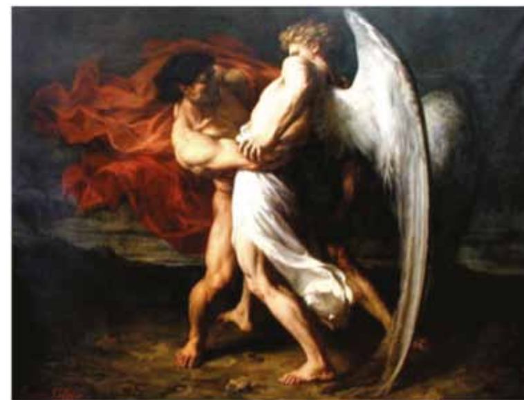
ALEXANDER LOUIS LELOR, Giacobbe lotta con l'Angelo , 1865

L'idea cristiana e le sue contraffazioni